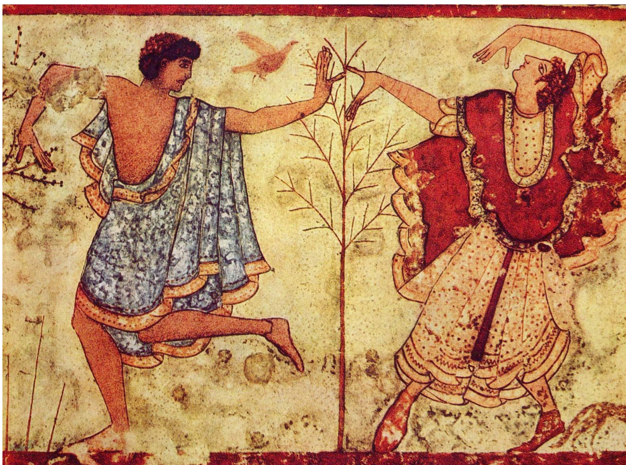
Pintura mural etrusca. Tumba de Triclinio, Tarquinia, 480 a. C.

(Filo: CyT, IAE, UBA / Academia Argentina de Letras)