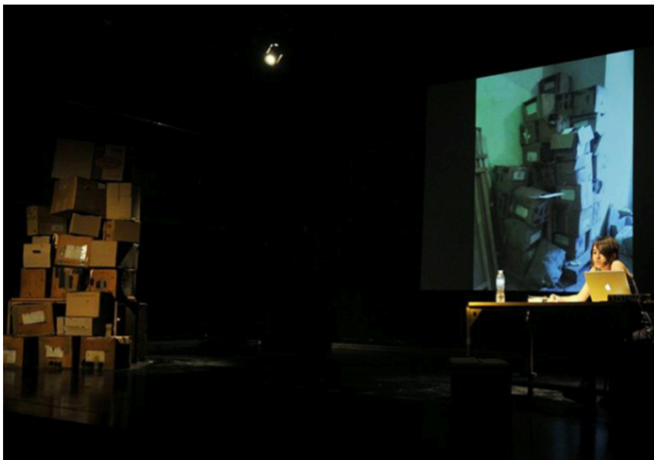
Capítulo 32 (2014), de Liza Casullo, presentada en el marco del ciclo Mis documentos bajo la curaduría de Lola Arias.

Grupo de Estudios sobre Teatro Contemporáneo, Política y Sociedad en América Latina (IIGG-FSOC-UBA)