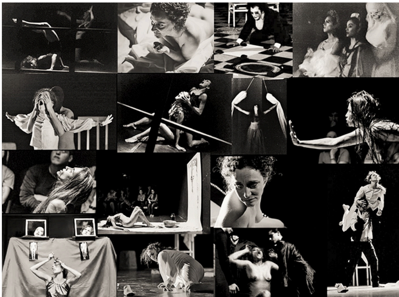
Collage de Paulina Antacli en base a imágenes publicadas en la revista Ágora , vol. 4, n. 7, 2019.