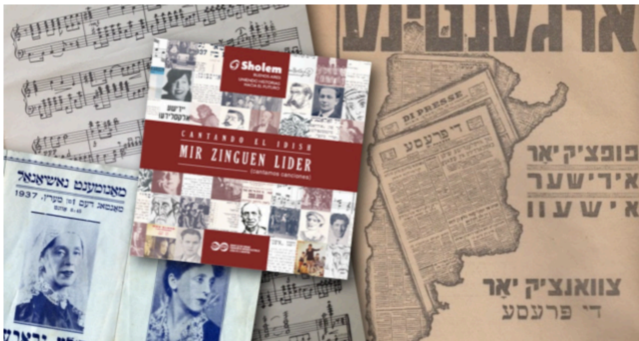
Sin título. Cuex Prácticas y Poéticas de la Judeidad Argentina, 2020.