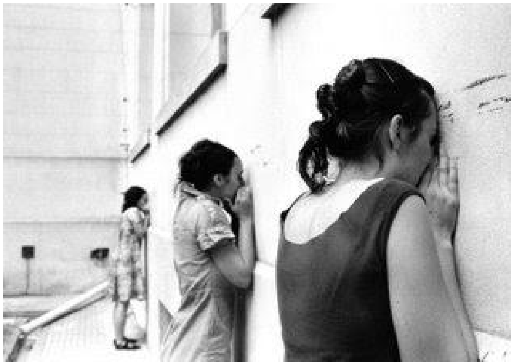
Siempre , de Diana Montequín y Mariana Estévez.